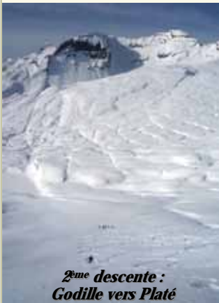
2 ème descente : Godille vers Platé

En guise de digestif, rien de tel qu'un bon petit exercice Arva. Certains auraient sûrement bien volontiers fait la sieste et nos virtuelles victimes d'avalanches auraient eu le loisir de la faire également ! Une simulation à renouveler régulièrement... Allez, assez joué maintenant ! On se sent tellement bien ici, mais il va falloir retrouver nos pénates quand même. Dernière montée, dernier effort : en suivant la trace qui serpente au gré des reliefs pour rallier la Tête des Lindards, la petite troupe soudée par ces bons moments partagés encourage ceux des leurs qui commencent à avoir les jambes lourdes, avant de se laisser glisser gentiment vers la vallée sur les pistes de Flaine.