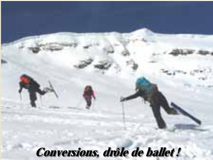
Conversions, drôle de ballet !

« Avec la perspective de cette belle journée de janvier, l'ambiance est joviale ce matin. Mais on n'en oublie pas pour autant la sécurité : un petit contrôle Arva en bonne et due forme dans la fraîcheur du parking, et nous voilà partis direction le Désert de Platé. Une fois n'est pas coutume, on emprunte le DMC de Flaine pour aller découvrir ce joli coin tout en ménageant les débutants (bonne excuse pour nous aussi, les encadrants et les faux débutants, en ce début de saison !). Arrivés aux Grandes Platières, nous sommes réchauffés par le soleil et éblouis par la majesté du paysage et de l'espace sauvage qui nous tend les bras.