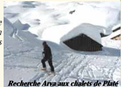
Recherche Arva aux chalets de Platé

La journée se termine, comme à l'habitude, autour d'un breuvage réparateur ! Et au moment de se séparer, tout le monde garde en mémoire ce grand rayon de soleil avec l'envie d'y revenir très vite. Des journées comme ça, on en redemande ! »