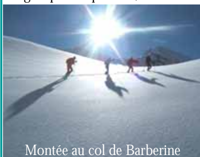
Montée au col de Barberine

Le groupe compétition, c'est aussi de superbes sorties en montagne entre amis où on allie plaisir et entraînement.