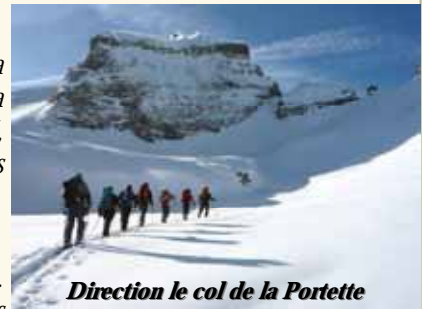
Direction le col de la Portette

On découvre alors les belles pentes qui plongent sur le vallon de Platé. Dépeutage sous la surveillance des chamois et on se lance dans cette deuxième descente qui nous permet de peaufiner la technique et le style par de jolies petites godilles. Pause casse-croûte au milieu des chalets de Platé, méconnaissables avec les paquets de neige sur les toits ; plein soleil, on reprend quelques forces (quelques douceurs typiques aussi) qui ne seront pas superflues pour aborder la suite de la rando.